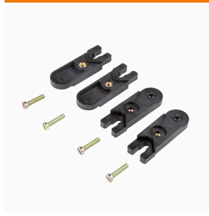
Utvändiga fästöron sats med vardera 4 styck