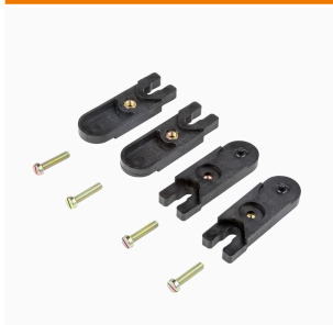
Utvändiga fästöron sats med vardera 4 styck