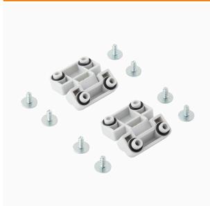
MPC-serien, Gångjärn, sats med 2 stycken