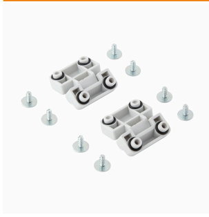
MPC-serien, Gångjärn, sats med 2 stycken