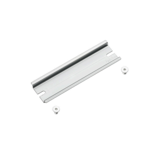
Klippon® K-serie, tillbehör