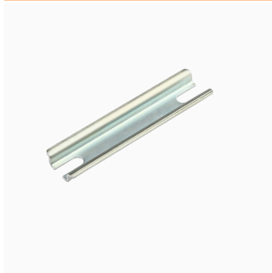
Klippon® K-serie, tillbehör