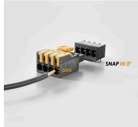
Fastest connection technology SNAP IN