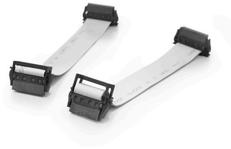
With optional strain relief