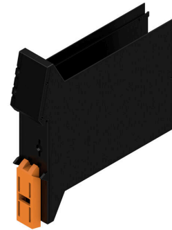
Baselement med SIM-ursparning