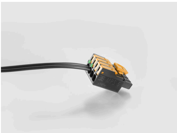
Acoustic and visual feedback