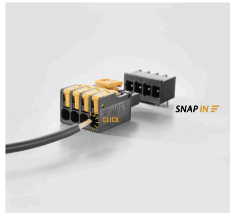
Fastest connection technology SNAP IN