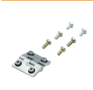
Klippon® K-serie, tillbehör