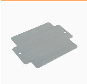
Klippon® K-serie, tillbehör