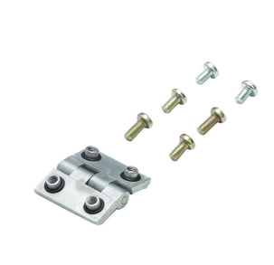
Klippon® K-serie, tillbehör