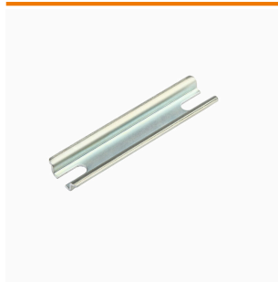
Klippon® K-serie, tillbehör