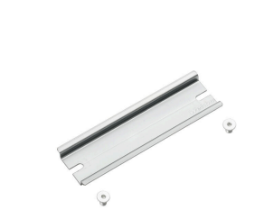
Klippon® K-serie, tillbehör