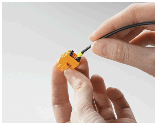
Fast PUSH IN connection Tool-free and touch-safe