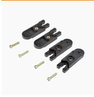
Пластины для наружного крепления Комплект по 4 шт.