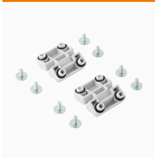
Серия MPC, петля, комплект по 2 шт.