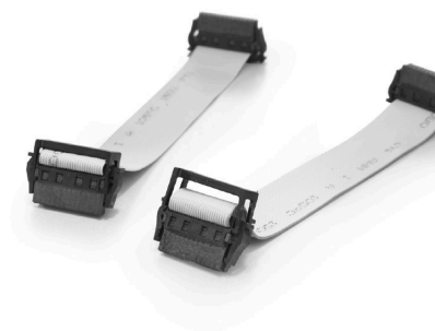
With optional strain relief