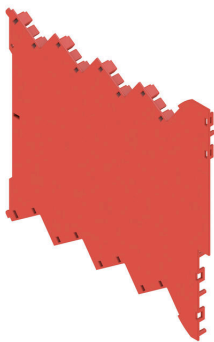
Базовый элемент без выреза в нижней части