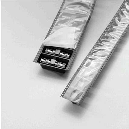
Packaged in tape-on-reel