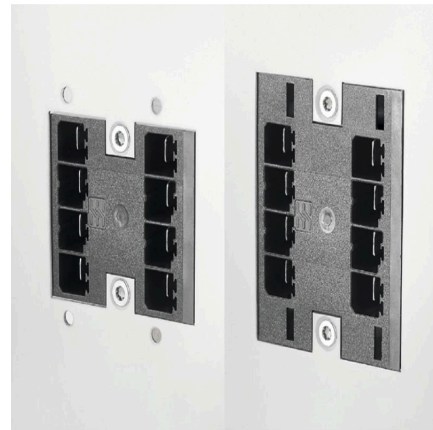
Space-saving power male header Through PUSH IN connection system