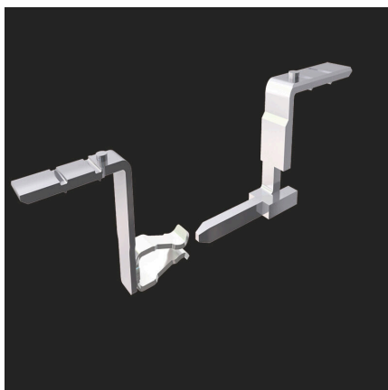
Uncompromising functionality High vibration resistance