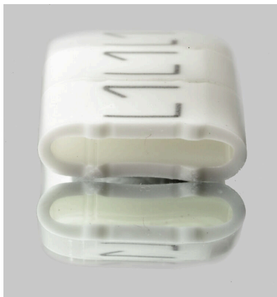
Podobny do przedstawionego na ilustracji