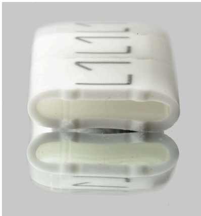
Podobny do przedstawionego na ilustracji