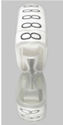
Podobny do przedstawionego na ilustracji