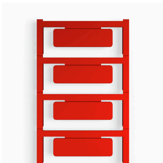
Podobny do przedstawionego na ilustracji