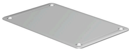
Podobny do przedstawionego na ilustracji