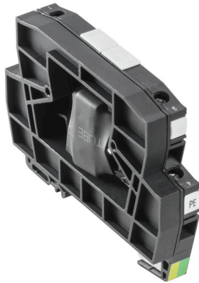
Podobny do przedstawionego na ilustracji