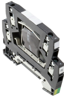
Podobny do przedstawionego na ilustracji