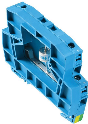
Podobny do przedstawionego na ilustracji