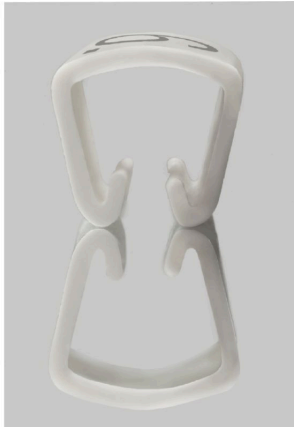
Podobny do przedstawionego na ilustracji