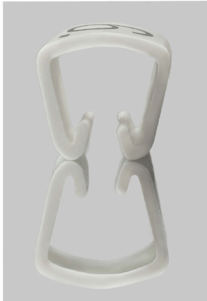
Podobny do przedstawionego na ilustracji