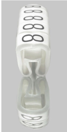
Podobny do przedstawionego na ilustracji