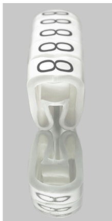
Podobny do przedstawionego na ilustracji