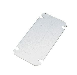
중판, 1.5 mm 시트 스틸, 도금