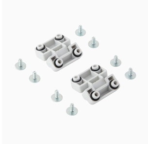
MPC 시리즈, 경첩, 2개 세트