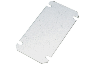
중판, 1.5 mm 시트 스틸, 도금