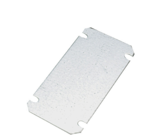
중판, 1.5 mm 시트 스틸, 도금