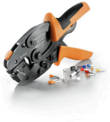
절연 및 비절연 페럴용 압착공구