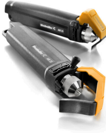
PVC 케이블용 탈피기