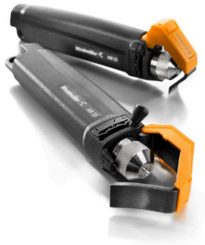
PVC 케이블용 탈피기