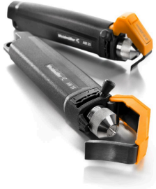
PVC 케이블용 탈피기