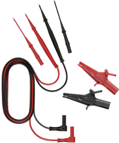
장비 테스트 및 측정용 액세서리