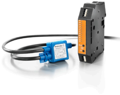
use with Rogowski coil