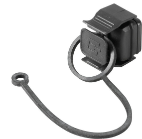
먼지 및 오염 물질로부터 디바이스 보호