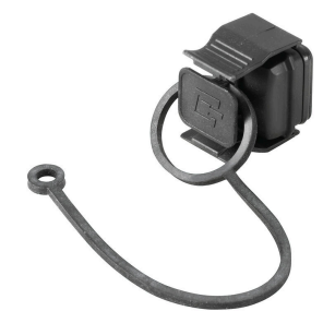
먼지 및 오염 물질로부터 디바이스 보호