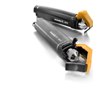
PVC 케이블용 탈피기