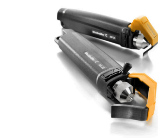
PVC 케이블용 탈피기