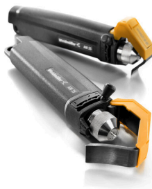
PVC 케이블용 탈피기