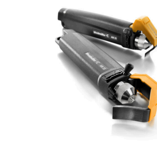
PVC 케이블용 탈피기