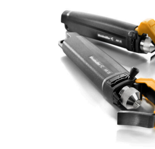
PVC 케이블용 탈피기