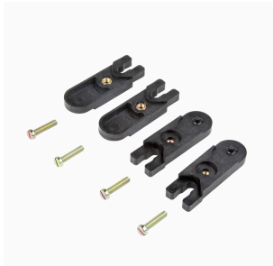
外部取り付けラグ 4 パーツセット