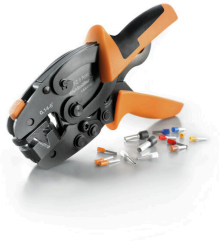
プラスチックカラーを使用時と不使用時の、フェルルール対応クリンプツール